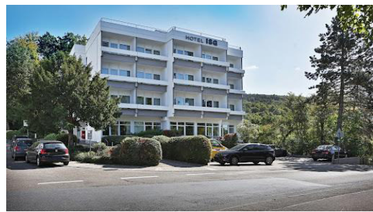
Veranstaltungsort: ISG-Hotel in Heidelberg / Boxberg Im Eichwald 19, 69126 Heidelberg

Als besonders wertvoll wird der Gewinn an Selbstkompetenz und persönlicher Ausstrahlung erlebt. Wir können Ihnen versprechen, dass Sie mehr für sich und Ihr persönliches Leben dazu gewinnen, als Sie erwarten. Aussagen wie: „die ILP-Ausbildung ist das Beste, was mir in meinem Leben passiert ist“, hören wir immer wieder.