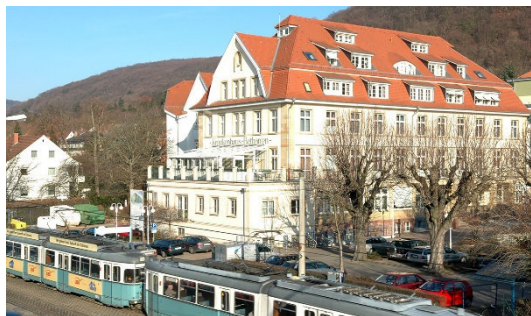
Veranstaltungsort: AGAPLESION AKADEMIE in Heidelberg Rohrbacher Straße 149, 69126 Heidelberg

Die ILP-Ausbildung umfasst 10 Module, die berufs begleitend am Wochenende angeboten werden. Weitere Details finden Sie auf den einzelnen Homepages und in den ausführlichen Ausbildungsunterlagen.